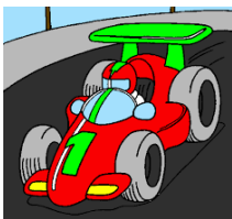
LA MACCHINA HA QUATTRO RUOTE