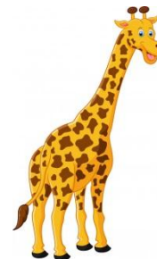
LA GIRAFFA HA IL COLLO LUNGO

IN QUESTE FRASI IL VERBO AVERE HA SIGNIFICATO DI POSSEDERE . INFATTI POSSO DIRE ANCHE