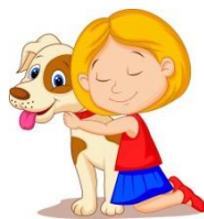
ELISA HA UN CANE